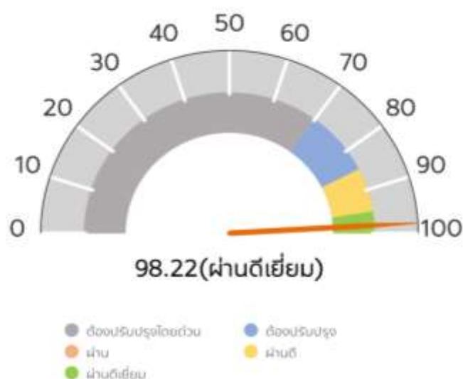
รูปภาพแสดงผลการประเมินในภาพรวม

องค์การบริหารส่วนตำบลท่าโฮมมีผลการประเมินคุณธรรมและความโปร่งใสในการดำเนินงาน ประจำปีงบประมาณ พ.ศ. 2566 ผลการประเมินในภาพรวม 98.22 คะแนน ระดับผ่านดีเยี่ยม